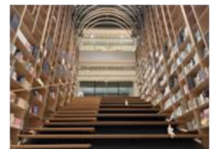
早稲田大学国際文学館